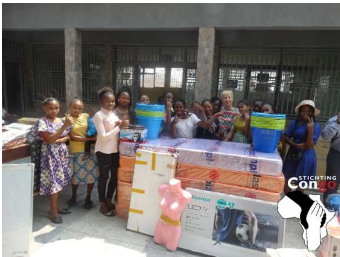
Foto 12: Ontroerend