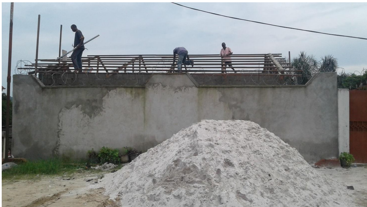
Atelier in aanbouw

Zo kunnen de jonge vrouwen voorzien in het levensonderhoud van henzelf en hun gezin. De hoop is dat deze jonge vrouwen een rolmodel zullen zijn voor andere tienermoeders.