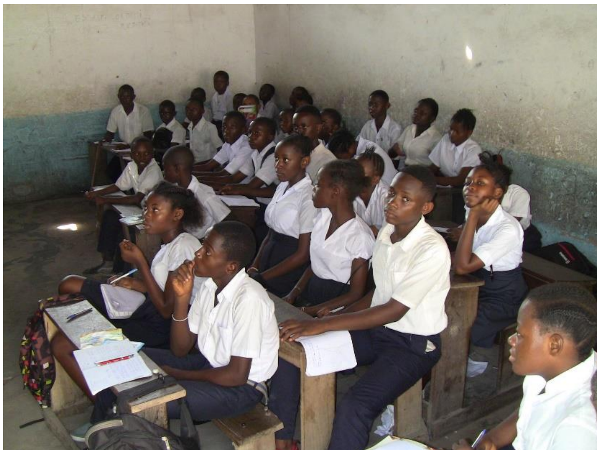
Klaslokalen zitten te vol.

Help ons om via kwalitatief goed onderwijs een verschil te kunnen blijven maken voor de kinderen in Congo.