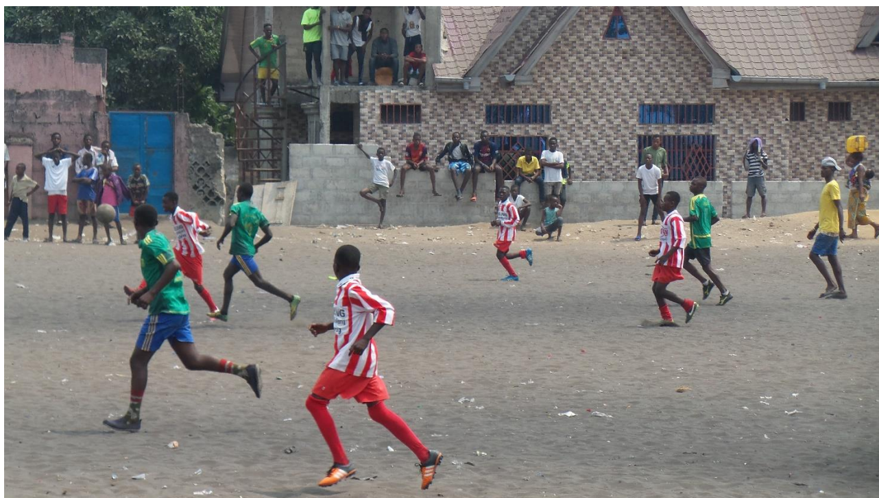
Jeugd en sport

Dit project is een sportproject dat investeert in kansarme kinderen in Kinshasa en andere delen van het land door voetbaltraining voor jongens en meisjes. Doelstelling is om de kinderen door middel van voetbal persoonlijke vaardigheden aan te leren om hun problemen aan te kunnen. Voetbal wordt ingezet als middel voor de kinderen om zichzelf te leren uiten, zich te concentreren op een doel, samen te werken en een goed voorbeeld te zijn in hun omgeving.